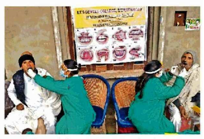
शिविर में ग्रामीणों के दांतों की जांच करते चिकित्सक 🌘 सौ : कालेज

जिला एमएमजी अस्पताल में कई कार्यक्रमः शुक्रवार को जिला एमएमजी अस्पताल गाजियाबाद में कई कार्यक्रम हुए। मेट्रो कालेज आफ नर्सिंग के छात्र-छात्राओं